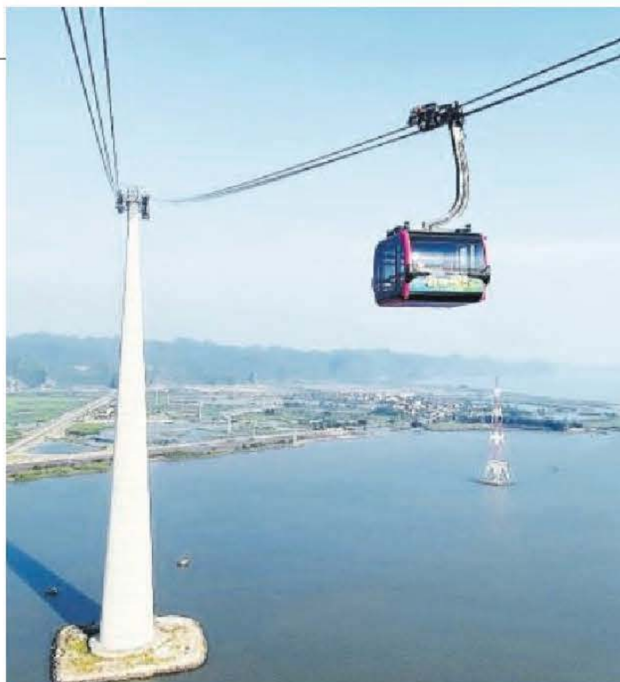
Doppelmayr-Seilbahn an Küste von Cat Hai mit höchster Stütze der Welt

zwei Jahre später bereits die ersten Fahrzeuge vom Band – nicht zuletzt dank Unterstützung von Magna und AVL bei der Serien- und Motorenentwicklung beziehungsweise Emissionstests. Mittlerweile hat man sich zu hundert Prozent der Elektromobilität verschrieben. Binnen 18 Monaten wurde in einem Industriegebiet am Meer um rund vier